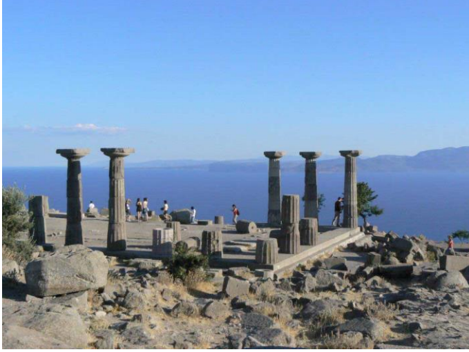
Foto.1 Behramkale-Assos Athena Tapınağı MÖ 530

çok sütunu armağan etmiştir. Figürlü sütun tamburlarına ait parçalar üzerindeki harflerin birleştirilmesi neticesinde de bu durum arkeolojik olarak belgelenmiştir. Ephesos Artemis Tapınağı dışında kabartmalı sütun tamburlarının kutsal bir yol ile Miletos'a bağlanan Didyma Apollon tapınağında da kullanıldığı bilinmektedir.