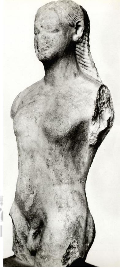
Foto.2 Arkaik Kuros, Kyzikos, M MÖ 540 (E.Akurgal, Griechische und römische römische Kunst in der Türkei , 1987,Taf.9)