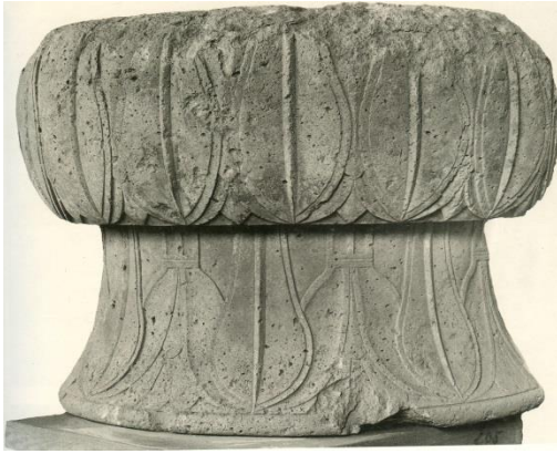
Foto.2 Bayraklı Athena Tapınağı Mantar tipi başlık MÖ 600 (E.Akurgal, Eski İzmir I, Yerleşme Katları ve Athena Tapınağı 1993, Lev.139a)