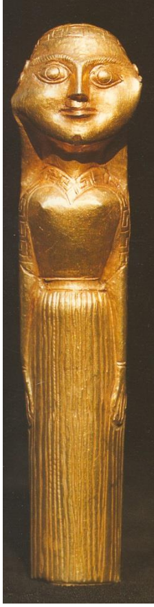
Foto.1 Altın Heykelcik, Ephesos Artemision MÖ 570-560 (E.Akurgal, Griechische und Kunst in der Türkei ,1987, Taf.81)

Homeros'un destanlarının halk arasında yayılması üzerine daha önceleri devlete ait gibi algılanan Olympos tanrıları halk tarafından da benimsenmeye başlamış ve tanrıların destan veya lirik edebiyatta tanımlanması ile “ antropomorfizm - insan biçimi anlayışı” ilerlemiştir. Böylece tanrılar başlı başına varlıklar haline gelmişlerdir.