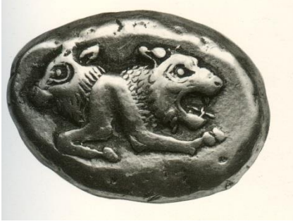
Foto.1 Boğa-Aslan Protomu betimlemeli elektron stater, Miletos, MÖ 620-580 (E.Akurgal, Griechische und römische Kunst in der Türkei , 1987, Taf.83d)

kadar başarı elde edilse de bu ayaklanma MÖ 494'de Miletos'un Persler tarafından tamamen tahrip edilmesi ve halkının köle yapılması ile son ermiştir.