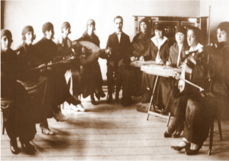
Resim 1. Dârü'l-Elhan Faslı Mûsikî Heyeti

Türk mûsikîsi kültürüne hizmet amacı ile kurulan Dârü'l-Elhan'ın açılması ile önemli bir göreve talip olunmuş ve misyon yüklenilmiştir. Gerek nazariyât gerekse uygulama alanına hizmet eden okul Türk mûsikîsi kültür ve bilincine sahip neferler yetiştirmeyi amaçlamıştır. Dârülelhan, savaş yıllarının çetin şartlarına rağmen açılmış ve o döneme rağmen uzun sayılabilecek bir süre eğitimini devam ettirmiştir. Bu sürekliliği sistemli ve otoriter bir yapıya borçludur. Okul için hazırlanan talimatname oldukça ayrıntılı ve açık bir üslupla yazılmıştır. Dersler başladıktan sonra verilen müfredat mûsikîye ait temel derslerin tamamını kapsamaktadır. Ses ve sesin özellikleri, mûsikî tarihi, usûl, nota, solfej, saz dersleri, dinî mûsikî, Batı mûsikîsi ve edebiyat gibi bu alanda verilmesi gereken tüm derslerin programda yer aldığı görülmektedir (Özden, 2015, s.70).