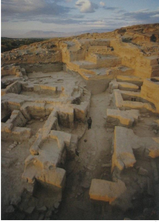
Foto 1 : Arslantepe Geç Kalkolitik Çağ “Kamu Yapıları” [Frangipane, M., Alle Origini del Potere. Arslantepe, la collina dei leoni , S.15,Milano.2004]

Bu gelişmeler hemen arkasından gelen Eski Tunç Çağında Anadolu' da yaşayan insanların birçok bölgede ilk şehir devletlerini kurmasına altyapı oluşturur.