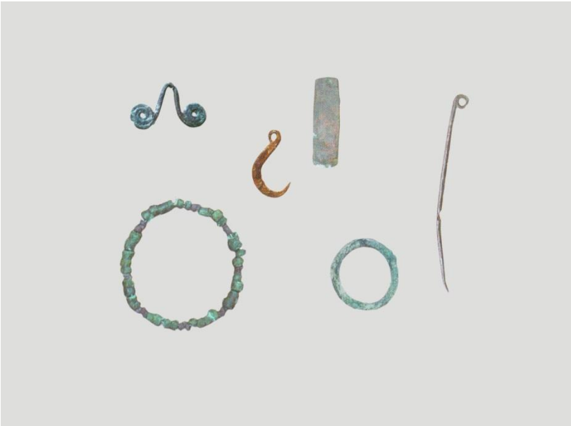
Foto 2 : İkiztepe' den metal eserler [ Bilgi,Ö., Anadolu,Dökümün Beşiği , S. 47, İstanbul, 2004.]