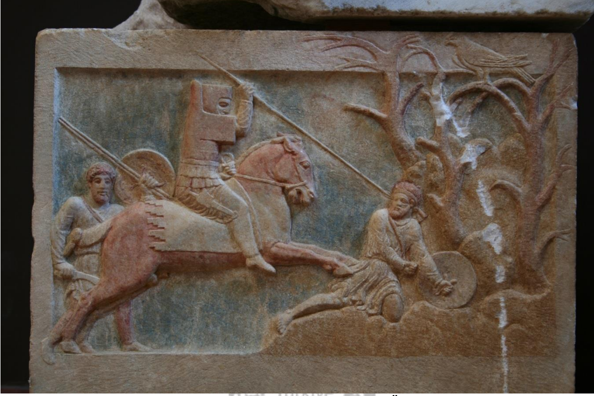
Foto.1 Çan Altıkulaç Lahdi, Çanakkale Arkeoloji Müzesi MÖ 4 yüzyıl

MÖ. 5. yüzyılın sonlarına doğru İonia alfabesinin kullanımının yaygınlaşması ile birlikte bir dil birliğinin oluşumuna doğru gidilmiştir. Ancak bölgesel alfabe kullanımı bir süre daha devam ettiği ve Yunanca dışında yerel dillerin de konuşmada ve yazıda kullanıldığı görülmektedir.