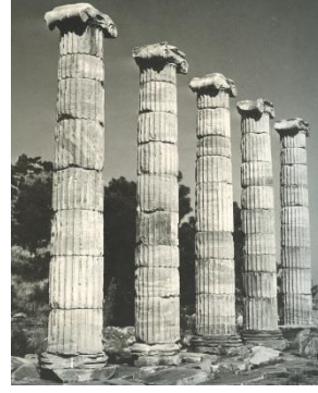
Foto.2 Priene Athena Polias Tapınağı MÖ 4.yüzyılın 3.çeyreği (E.Akurgal, Griechische und römische Kunst in Der Türkei (1987) Taf.139