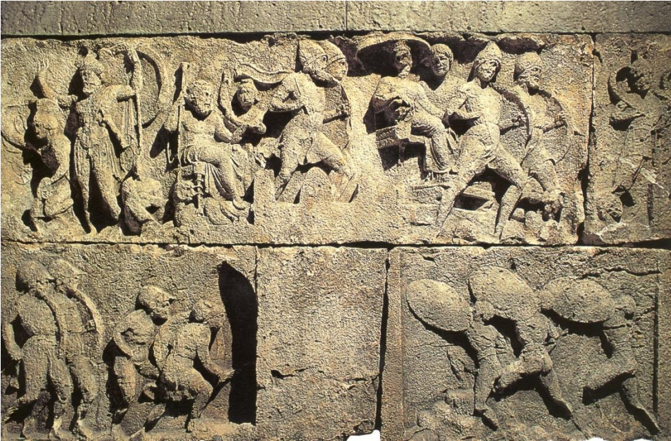
Foto.2 Trysa-Gölbaşı Heroonu batı duvarı merkezi sahne bir kentin kuşatılması MÖ 380-370 (W.Oberleitner, Das heroon von Trysa, 1994, Abb.75)