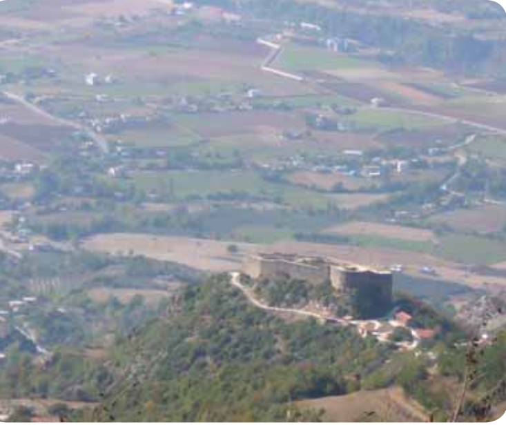
Harun Reşit Kalesi ve Düziçi Ovası