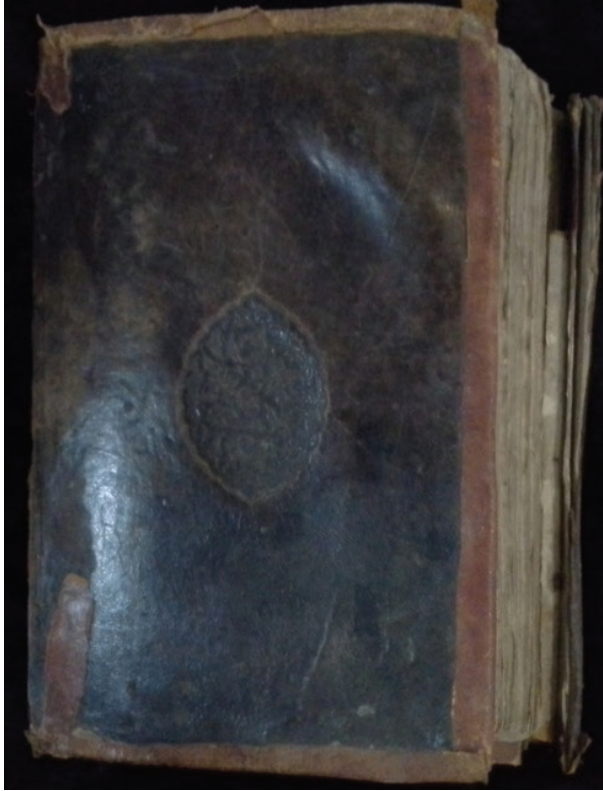
Resim 5. Mushaf-ı Şerif Cilt