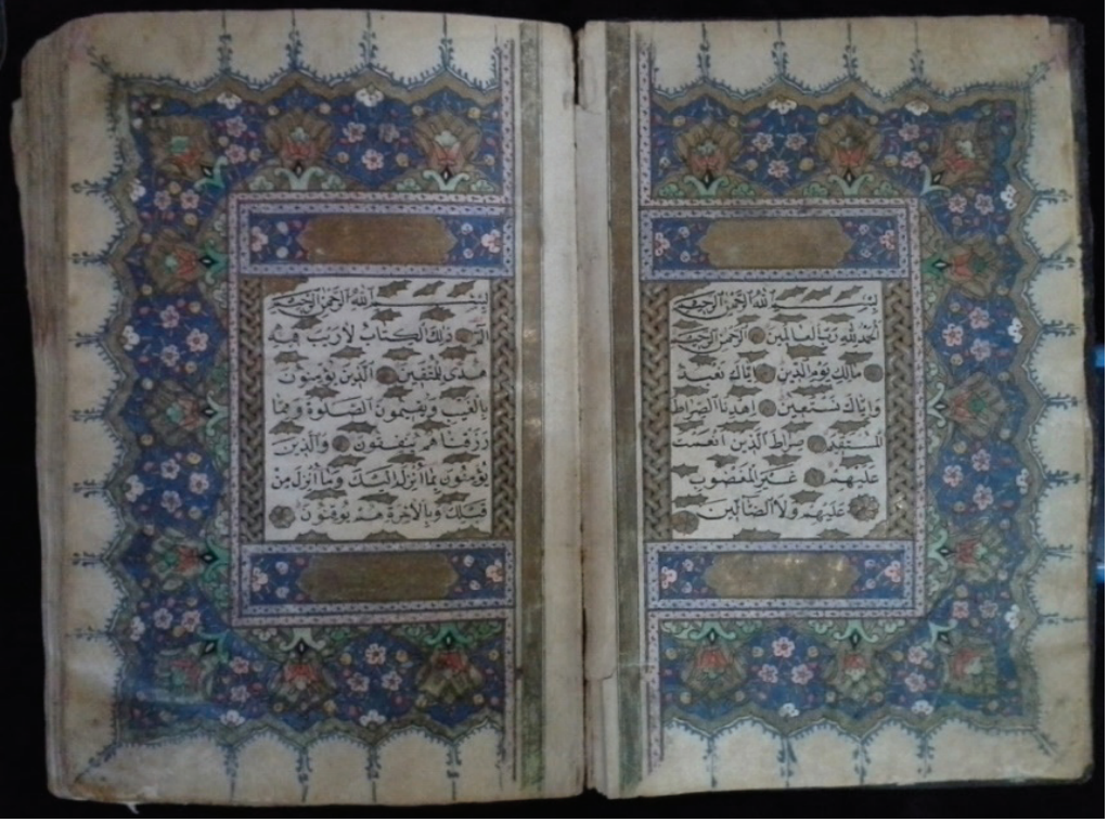
Resim 4. Fatiha ve Bakara Suresi Serlevha Sayfası Tezhibi

Eserin genel özellikleri: 60-00253 envanter numarasıyla kayıtlı olan Kur'an-ı Kerim h.1258/m.1843 tarihinde nesih hattıyla yazılmıştır. Eserin istinsah edeni belli değildir. Tokat Mevlevihane Müzesinde, el yazma eserler odasında bulunan eser Mevlevihane'ye kim tarafından vakfedildiği bilinmemektedir. Eserin 15 satır sayısı 12. 5 cm eni, 19 cm boyu 3 cm derinliği bulunmaktadır. Koyu kahve renkte olan Kur'an-ı Kerim'in cildi yıpranmış durumdadır. Eserin alt kapağı bulunmamaktadır. Üst kapağının ise derisinde soyulmalar mevcuttur. Üst kapağına baskı ile dikdörtgen bir form içerisine noktalar yapılmıştır. Eserin sayfa düzenlemesinde, her sayfanın yazı alanına altın ile cetvel çekilmiştir. Eserin hatime sayfası bulunmamakla beraber sayfalarından bazıları da kopmuştur. Cildin şirazesini dağılmış, kâğıtları yıpranmış ve mahfazası yoktur.