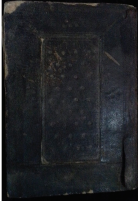
Resim 3. Mushaf-ı Şerif Cilt