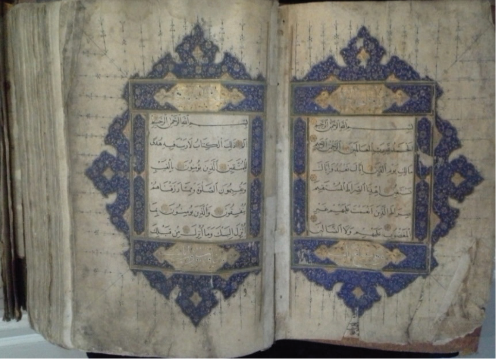
Resim 6. Bakara ve Fatiha Suresi Serlevha Sayfası Tezhibi

Eserin genel özellikleri: 60-00196 envanter kayıtlı olan Kur'an-ı Kerim nesih hattıyla yazılmıştır. Eserin istinsah edeni ve tarihi belli değildir. Tokat Mevlevihane Müzesinde, El yazma eserler odasında bulunan eser Mevlevihane'ye Amasya Gümüşhacıköy, Gümüş kasabasında bulunan Yörgüç Paşa Camisi (Rüstem Paşa Camii) tarafından vakfedilmiştir. Eserin 11 satır sayısı 24 cm eni, 34 cm boyu 10 cm derinliği bulunmaktadır. Koyu kahve renkte olan Kur'an-ı Kerim'in kabı yıpranmış durumdadır. Kitabın alt ve üst kapağında salbeksiz soğuk şemse uygulanmıştır. Şemse içerisinde yapraklardan, pençlerden oluşan bir kompozisyon bulunmaktadır. Cildin derisinde soyulmalar ve bantlar vardır. Kitabın sayfa düzenlemesinde her sayfanın yazı etrafına kırmızı cetvel çekilmiştir. Kitabın cildi, şirazesı, miklebi restorasyon görmüştür. Cildin mahfazası yoktur.