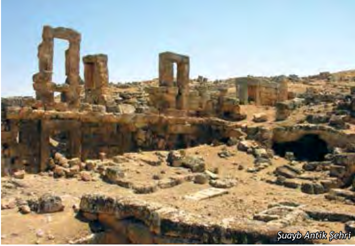
Şuayb Antik Şehri

Bu yerleşim yerinde çeşitli tarihlerde bilim adamlarının yaptığı araştırmalar sonucu varılan ortak görüş, Şuayb Şehri isminin Arapçada "Eski İnsan Şehri" anlamına geldiği ve bu yerleşim içinde yer alan evlerin ise Harran Ovası'nda yaşayan insanların yazlıkları olduğu şeklindedir.