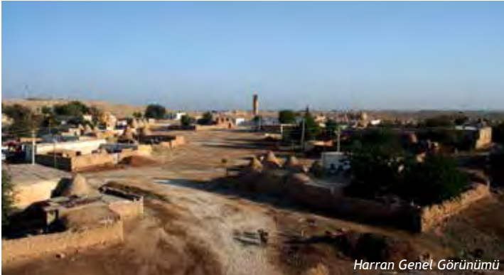
Harran Genel Görünümü

Harran, etimolojik yapısı itibariyle eski uygarlıklarda "yolların kavuştuğu yer", "kavşak" anlamına gelmektedir. Önsya dili olan Akatça'daki "Harranu" sözcüğüyle "Seyahat ve Kervan" anlamına gelir. Sosyolojik ve tarihsel düşünüldüğünde ise, Me-