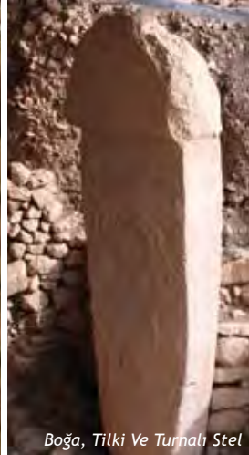
Boğa, Tilki Ve Turnalı Stel