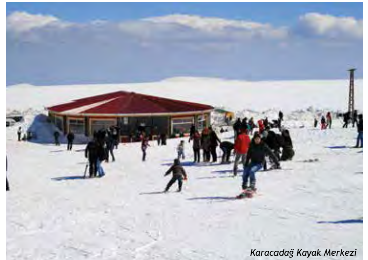
Karacadağ Kayak Merkezi

Tüm Bölge içinde kar tutan ender yerlerden olan Karacadağ'da Valilik tarafından kayak pistleri düzenlenmiştir. 600-700 m. uzunluğunda pistler için 250m.lik bir lift yapılmıştır. Siverek İlçemize 60 km. mesafede olan kayak merkezinde 60 M 2 'lik bir kafeterya ile 30 M 2 'lik bungalow tipi hizmet evi bulunmaktadır. Kasım ayından itibaren dört aylık kayma sezonu vardır.