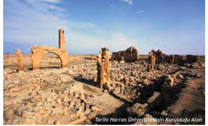
Tarihi Harran Üniversitesinin Kurulduğu Alan

Bu Ekollerin oluşmasında Harran'daki mütercimlerin, Yunan Felsefesi konulu Latince yazılmış eserlerden Arapçaya yaptıkları çeviriler önemli rol oynamıştır.