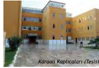
Karaali Kaplıcaları (Tesis)

150.000 m 3 /saat sıcak su kapasitelidir. 1997 yılında hizmete açılmıştır. 54 daireden oluşan bir apart otel de Şubat 2000 'de hizmete açılmıştır. 49-55 derecedeki sıcak suyun, sinir sistemi, eklem, cilt, dolaşım ve benzeri hastalıklar için şifa özelliği taşıdığı tespit edilmiştir. Karaali Kaplıcaları, Kaplıca Turizmi dışında seracılık amaçlı da kullanılmaktadır.