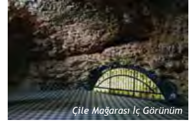
Çile Mağarası İç Görünüm