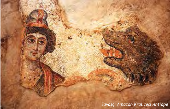
Savaşçı Amazon Kraliçesi Antiope

Halepli Bahçe'de Şanlıurfa Valiliği imkânlarıyla Şanlıurfa Arkeoloji Müzesi Başkanlığında ve arkeologlarımızın nezaretinde, ilk etapta 100 m 2 'lik mozaik gün ışığına çıkarılmıştır. Av sahnesi mozaığının kenar bordürlerinde, geometrik motifler, bitki desenleri, güvercin, kanatsız eros, sincap, ördek, keklik, ceylan ve tazi figürlerine yer verilmiştir. Mozaiği çevreleyen bordürün köşelerinde ise "Edessa Güzeli" diye kamuoyuna yansıyan, mask dışında, ana sahnede dört amazon kraliçesi Hippolyte (Hipplüte), Antiope, Melanipe (Melanipe) ve Penthesileia (Pentesileya) savaşçı amazon kadınlarına özgü giysileriyle, tek göğüslü olarak at üstündeki av sahneleri tasvir edilip Grekçe isimlerine yer verilmiştir.