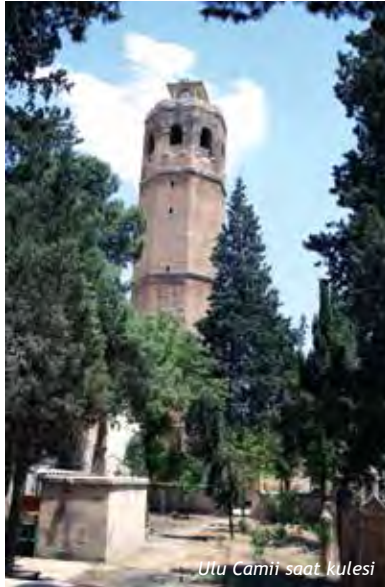
Ulu Camii saat kulesi

Bazalt parke döşeli dar sokağın kesme taştan yüksek duvarlarla sınırlandırıldığı bu bölümünde Abdülkadir Hakkâri Evinden sokağa taşan konsol ve gönye çıkımlar kabaltı ile birlikte sokağa güzel bir görünüm kazandırmıştır. Aynı sokakta restore edilerek konukevi fonksiyonu verilen "Yıldız Sarayı Konukevi", Urfa'da konukevi ve restaurant olarak hizmet veren geleneksel Urfa evlerinin en büyüğüdür.