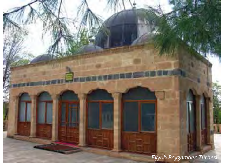
Eyyub Peygamber Türbesi

Hz. Eyyüb, Urfa'da şifa bulduktan sonra Eyyübnebi Beldesi'ne geri dönmüştür. Burada uzun süre yaşamış mal, mülk ve evlat