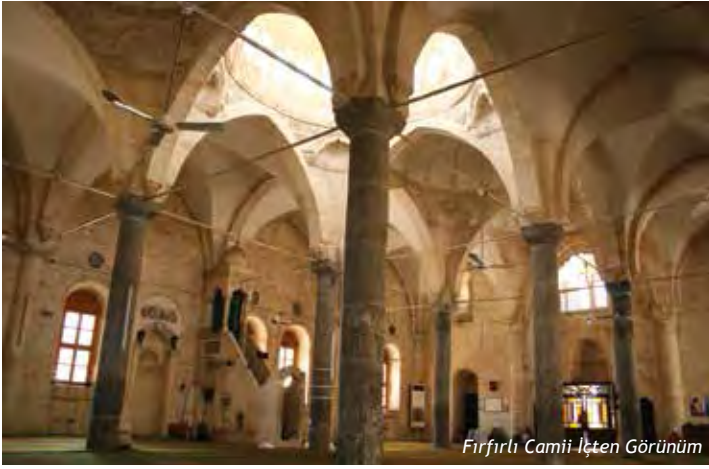
Firfirli Camii İçten Görünüm

Camiye çevrilirken özel bir isim kullanılmamış üzerine konulan rüzgârgülünden dolayı Urfa Şivesi ile “Fırırılı Camii” ismi kullanılmıştır. Yapının dikkat çeken yönlerinden birisi de yarım sütunlar ile dış cephelerdeki taş duvarda bulunan bezemelerdir.