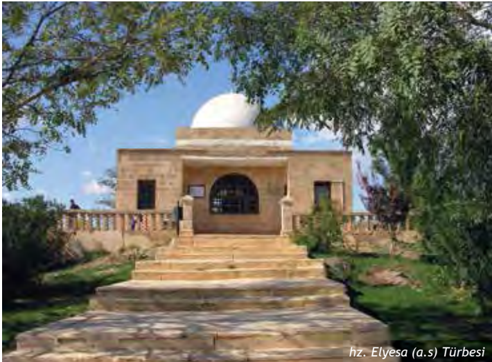
hiz. Elyesa (a.s.) Trbesi

Hiz. Elyesa (a.s.) Hiz. Eyyb'un aędaşıdır. Rivayete gre; Őam diyarından g ederek Hiz. Eyyb (a.s.)'u grmeye gelen Hiz. Elyesa, Eyybnebi Ky'ne vardığıında yoluna Őeytan ıkar, yaşı bir insan kılığında Hiz Elyesa'ya grnr ve O'na "Ey yaşı insan boşuna yorulma Eyyb'u bulamasın O buralardan g etti ok uzaklara gitti bu yaşı halinle O'nu bulman mmkn deęil" diyerek Hiz. Elyesa'yı kandırır. Hiz. Elyesa artık yaşılanmıştır yryecek gc kalmamıştır, hemen oracıkta Rabbine sığınarak