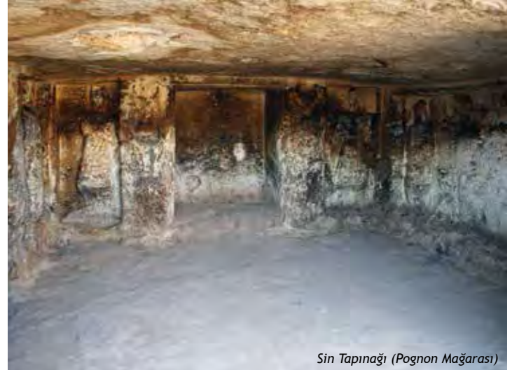
Sin Tapınağı (Pognon Mağarası)