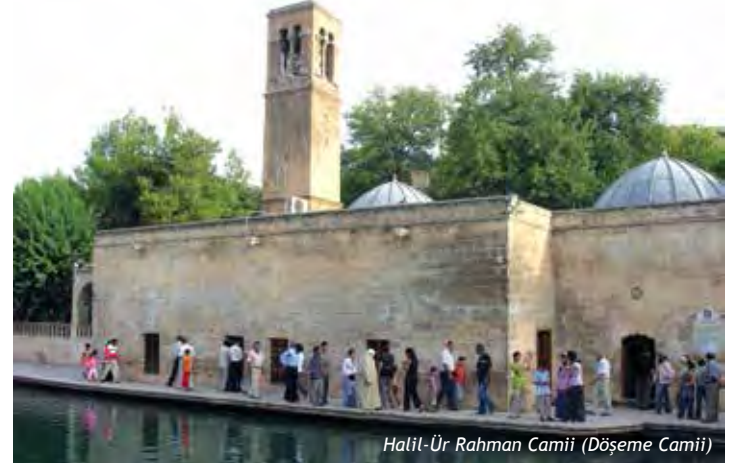
Halil-ür Rahman Camii (Döşeme Camii)

Halil-ür-Rahman Gölü'nün(Balıklıgöl) yanında yer almaktadır. Cami halk arasında "Döşeme Camisi" olarak ta isimlendirilmektedir. 504 tarihinde Rahip Urbisyus tarafından Hz. İsa Peygamber'in annesi Hz. Meryem adına bir kilise inşa ettirilmiştir.