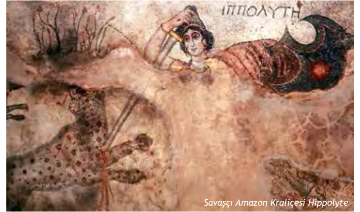
Savaşçı Amazon Kraliçesi Hippolyte

Bahçe Mozaiklerinin mozaik tekniği, sanatı ve 4 m 2 ebadında Fırat Nehri'nin orijinal taşlarından yapılması ve benzeri özelliklerinden dolayı, dünyanın en kıymetli mozaiği olarak tanınmaktadır.