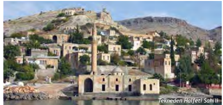
Tekneden Halfeti Sahili

İlçenin bir kısmı Birecik Barajı’nın göl suları altında kalmıştır. Yeni yerleşim yeri olarak ilçe merkezine 7 km. mesafedeki Karaotlak mevkii seçilmiş ve yerleşime açılmıştır. Kentin simgesi haline gelen ‘siyah gül’ yerli yabancı tüm konukların ilgisini çekmekte, önemli bir ticaret potansiyeli içermektedir. Teknelerle ortalama bir saat süren tekne yolculuğu ile Rumkale’ye ve tarihi Savaşan Köyüne geziler yapılabilmektedir.