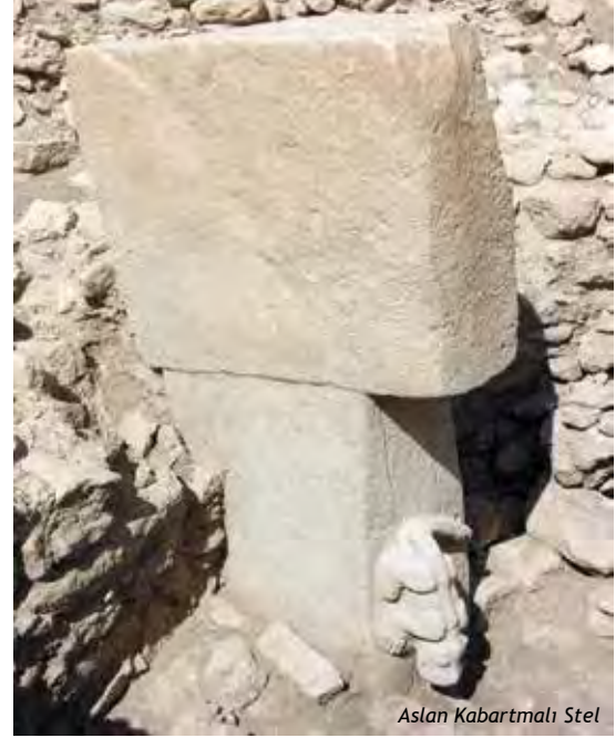
Aslan Kabartmalı Stel