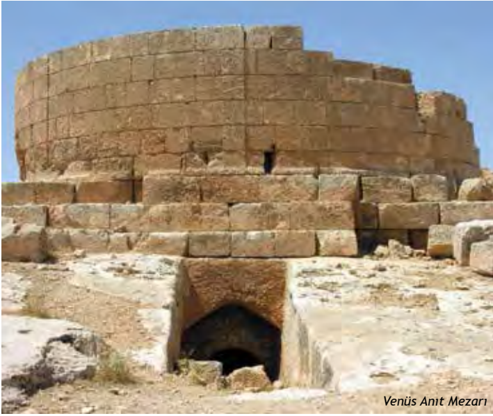
Venüs Anıt Mezarı

Soğmatar kült yeri, özellikle M.S. 165 yıllarında Partların (İranlılar) Urfa bölgesine yaptıkları yoğun saldırılardan dolayı bölgeden kaçan halk tarafından kurulmuş ve İslam Dönemi'ne kadar kült merkezi özelliğini korumuştur. Soğmatar'da, Şuayb Şehri gibi su ihtiyacını karşılamak için ana kayaya oyulmuş su kuyuları bulunmaktadır. Soğmatar Antik Kentindeki tarihi kuyunun Hz. Musa Kuyusu olduğu rivayet edilir.