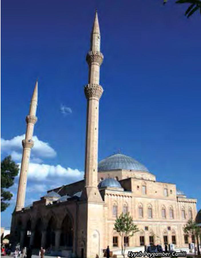
Eyyub Peygamber Camii