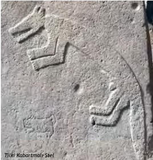
Tilki Kabartmalı Stel

Anlaşılan o ki; gelecekte yapılacak kazılar, Göbeklitepe’nin kendine has birçok sırrı sakladığını ortaya çıkaracaktır.