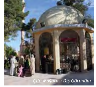
Çile Mağarası Dış Görünüm

Cenâb-ı Hakk, sevgili kulu Hiz. Eyyûb’un duasını kabul eder. Topuğunu yere vurmamasını, çıkacak olan su ile yıkanmasını ve bu soğuk suyu içmesini emir eyler. Hiz. Eyyûb emr-i İlâhî’yi yerine getirir ve vücudunun hem içini, hem dışını onunla temizler. Böylece hastalıklardan kurtulur. Şifalı Kuyu’nun 150 metre kadar batısındaki kalıntıların altında kayalardan oyulmuş bir hamam olduğu, bu hamamda cüzamlı hastaların ve romatizma hastalıklarının tedavisinin yapıldığı yazılı ve sözlü kaynaklarda belirtilmektedir.