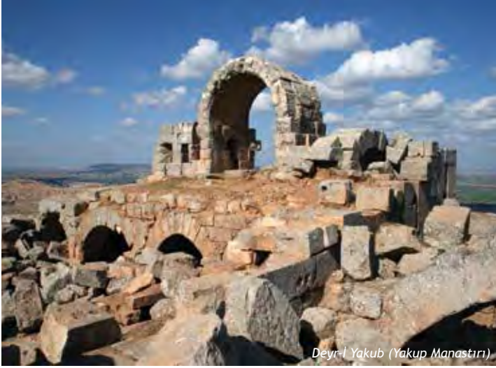
Deyr-i Yakub (Yakub Manastırı)

Deyr-i Yakub (Yakub Manastırı), Merkeze 10 km. uzaklıkta, güneydeki dağların üzerinde yer alır. Halk arasında Hz. İbrahim Peygamber'in mücadele ettiği Kral Nemrud'un burayı seyfiye alanı olarak kullandığına inanılır. Bu bölgedeki yapı için, halk arasında "Nemrud'un Tahtı" ya da "Cin Değirmeni" ifadeleri kullanılır. Manastırın kuzeybatısında yer alan anıt mezarda bir kitabe yer alır. Bu kitabenin ilk satırı Grekçe (Eski Yunanca), ikincisi satırı Pamyra Süryanicesi ile yazılmıştır. Yazıt, muhtemelen 2. yüzyılın sonuna veya 3. yüzyılın başlarına aittir. Manastırın da bu tarihlerde yaptırıldığı tahmin edilmektedir.