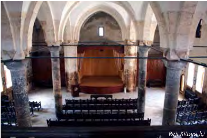
Reji Kilisesi İçi