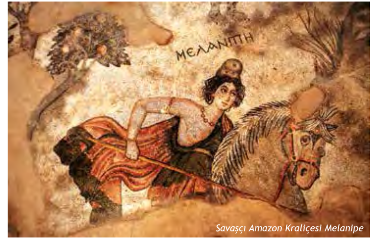
Savaşçı Amazon Kraliçesi Melanipe

Haleplibağçe'de yapılan kazı çalışmaları sonucu farklı mozaikler de ortaya çıkmıştır. Bunlar arasında en önemlilerinden biri Truva Savaşı'nın kahramanlarından Aşil (Akileus)'dir. Alanda Aşil'in hayat hikâyesini konu alan taban mozaiği, Şanlıurfa Müzesi arkeologları tarafından ortaya çıkarılmıştır.