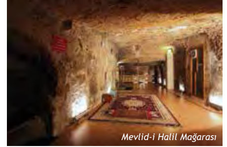
Mevlid-i Halil Mağarası

İlk olarak Seleukoslar döneminde alana, bir putperest tapınağı yapılır. Yahudilik döneminde aynı alanda bir havranın varlığından bahsedilir. Hıristiyanlığın ilk dönemlerinde, M.S.150 yılında, aynı alana Hıristiyanlar Kilisesi adında bir kilise inşa edilir. Bizans döneminde bu alana Urfa Ayasofyası yapılır. Son olarak; Osmanlı döneminde 1523 tarihinde Muhammed Salih Paşa tarafından aynı alana cami inşa edilmiştir. Halk tarafından Mevlid-i Halil Mağarasından çıkan suyun zembemden sonra en şifalı su olduğu kabul edilmektedir.