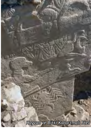
Hayvan ve Bitki Kabartmalı Stel

Mimarlık tarihi, insanoğlunun avcı ve toplayıcı toplumdaki yerleşik topluma geçmesi ile başlar. Göbeklitepe’de bulunan 12.000 yıllık yapılar, mimarlık tarihinin başlangıcı olarak kabul edilmiştir. İnsanoğlunun tek tanrılı dinlerden önceki çok tanrılı döneme ait ilk tapınağı, M.Ö.4.000 yılına tarihlenen Malta Adası’ndaki tapınak olarak biliniyordu. Göbeklitepe Tapınağı’nın tespiti ile bu bilgiler geçerliliğini yitirmiş ve insanoğlunun ilk tapınağının günümüzden 12.000 öncesine tarihlenen “Göbeklitepe Tapınağı” olduğu bilimsel verilerle kanıtlanmıştır. Bu tespit ile birlikte arkeoloji tarihi yeniden yazılmaya başlanmıştır.