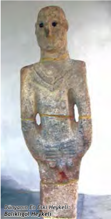
Dünyanın En Eski Heykeli: Balıklıgöl Heykeli

Şanlıurfa Arkeoloji Müzesi sahip olduğu 74.000 eser sayısı ile Türkiye'nin 5. büyük müzesidir. Paleolitik dönemden günümüze değin birçok eseri Şanlıurfa Müzesi'nde görmek mümkündür. “12.000 Yıllık Dünyanın En Eski Heykeli: Balıklıgöl Heykeli” müzemizde sergilenmektedir.