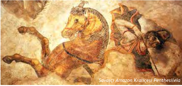
Savaşçı Amazon Kraliçesi Penthesileia

Bahçe Mozaiklerinin mozaik tekniği, sanatı ve 4 m 2 ebadında Fırat Nehri'nin orijinal taşlarından yapılması ve benzeri özelliklerinden dolayı, dünyanın en kıymetli mozaiği olarak tanınmaktadır.