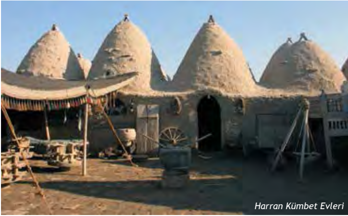
Harran Kümbet Evleri

Harran'la özdeşleşen kümbet evlerin (Konik Evler) büyük çoğunluğu hala mevcudiyetini korumaktadır. Bu evlerin benzerlerine, Şanlıurfa'ya bağlı Suruç ve Birecik kırsalındaki köylerde de rastlamak mümkündür. Ancak, Harran'daki evlerin diğerlerinden ayrılan bariz farkı, üst örtüsünde tuğla kullanılmasıdır. Harran'daki evlerinin tuğla ile örtülmesinin iki sebebi vardır. Biri, bölgenin çöl olmasından dolayı ağaç malzemenin bulunmayışı, diğeri ise, Harran'da bol miktarda bulunan tuğla malzemedir. Evlerin yüksekliği içerden en çok 5 metreye varan konik külahlar, 30-40 tuğla dizisi ile örülmüştür. Örgüleri düzensiz bir şekilde balçık sıva ile bağlanan üst örtü duvarlar, içerden ve dışarıdan yine bu harçla sıvanmıştır. Harran evleri bölge iklimine uyumlu olarak yazın serin, kışın sıcaktır.