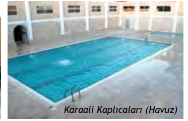
Karaali Kaplıcaları (Havuz)