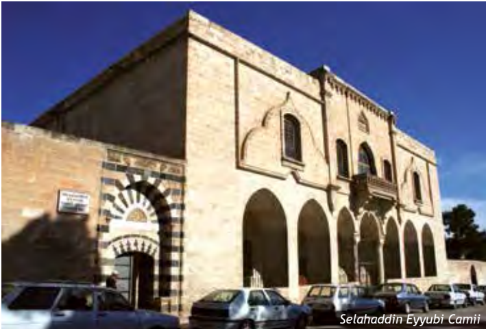
Selahaddin Eyyubi Camii

Yapı, Vali Fuat Bey Caddesi’nde (Büyükyol) bulunmaktadır. 457 yılında Piskopos Nona tarafından yaptırılan Vaftizci Yahya Kilisesi’nin üzerine 19.yy başlarında inşa edildiği tahmin edilmektedir. Dönemi ve bölgedeki en büyük kilise olması dolayısıyla katedral olarak da adlandırılmıştır. Yapı uzun yıllar harap durumda kalmış ve bir ara elektrik santrali olarak kullanılmıştır. 28 Mayıs 1993’te onarımı yapılarak cami olarak ibadete açılmıştır. Caminin girişi batı yönünde olup, son cemaat yeri de daha önceki kilisenin narteksinden(giriş bölümü) yararlanılarak