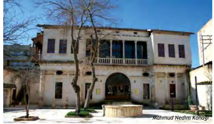
Mahmud Nedim Konağı

Eski Devlet Hastanesi yakınındadır. 1903 tarihinde inşa edilmiştir. Avrupai tarzda konak mimarisi ile geleneksel tarzda Urfa evi mimarisinin kaynaştığı bir özelliğe sahip olan ve oldukça geniş bir alana yayılan konak, haremlik ve selamlık bölümlerinden meydana gelmiştir. 1940'lı yıllarda Halk Tiyatrosu bu binada gösteriler yapmıştır. Konak, Şanlıurfa Valiliği tarafından onarılmış ve 11 Nisan 2009'da “Şanlıurfa Kurtuluş Müzesi” olarak hizmete sunulmuştur. Ayrıca Konağın bir bölümü, Devlet Türk Halk Müziği Korosu'na tahsis edilmiştir.