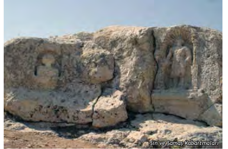
Sin ve Şamaş Kabartmaları

Soğmatar Antik Şehri Merkez ilçe sınırlarına dâhildir. İdari olarak Harran ilçe sınırları içine girmese de Harran-Eyyubnebi Turizm yolu güzergâhında olduğu için buraya alınmıştır. Şuayb Antik Şehri'nden 18 km. sonra, Soğmatar Antik Şehri'ne varılır. Burası, Harran'a ise 57 km. mesafededir. Roma dönemine (M.S. 2. yüzyıl) tarihlenen bölge, Abgar Krallığı döneminde Harranlıların Tektik Dağları bölgesinde; ay ve gezegen tanrıları için tapındıkları bir kült merkezi olduğu kabul edilmektedir. Soğmatar kült yerinde; Ay tanrısı Sin'e tapınılan bir mağara (Pognon Mağarası), yamaçlarında yer yer tanrı kabartmalarının ve zemine kazılmış yazıtların olduğu bir tepe (Kutsal Tepe), 6 adet kare ve yuvarlak planlı mozole (Anıt Mezar), iç kale ve ana kayaya oyulmuş çok sayıda kaya mezarı bulunmaktadır.