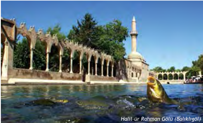
Halil-ür Rahman Gölü (Balıklıgöl)

Urfa Kalesi'nin kuzeyinde bulunan Halil-ür Rahman Gölü((-Balıklıgöl) Hz. İbrahim için "ateşin serin ve selamet olduğu" mekândır. Kutsal kitaplara göre; M.Ö. 2.000 yıllarında Urfa'da yaşayan Nemrud Bin Ken'an'ın ilahlığını reddeden ve akıl yoluyla Rabbini bulan ilk insan Hz. İbrahim, Nemrud ve ahalisinin tapındığı putları kırınca ateşe atılmasına karar verilmiş, Mucize-i İbrahim bu mekânda gerçekleşmiş ve mekân gül bahçesine dönüşmüştür. Bu inanış semavi dinlerce ve nesilden nesile aktarılan halk hafızasındaki bilgilerce de kabul edilmektedir.