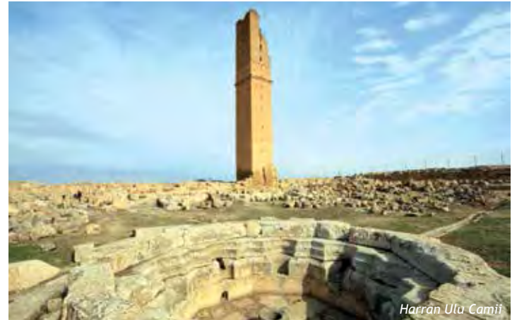
Harran Ulu Camii

Harran, M.S. 639 yıllarında Halife Hz. Ömer zamanında İslam hâkimiyetine geçmiştir. Harran, İslam devrinde Emeviler döneminde son halife II. Mervan zamanında da bir süre başkent olmuştur. İslam Devri'nin önemli eserlerinden olan Ulu Cami veya Cennet Cami, Harran höyüğü'nün kuzeydoğu eteğinde yer alır. Caminin doğu cephesi mihrabı, şadırvanı ve minaresinin büyük bir bölümü korunmuştur. Türkiye'de İslam mimarisinde yapılmış en eski cami olan Harran Ulu Cami, M.S. 744-750 tarihleri arasında Emeviler devrinde Halife II. Mervan tarafından yaptırılmış ve daha sonra çeşitli zamanlarda onarımlar görmüştür. Ulu Cami 104x107 m. ebadında bir alanı kaplar, minarenin zaman içinde yok olan ahşap merdivenleri, aslına uygun bir şekilde 105 basamaklı olarak yeniden yapılmıştır.