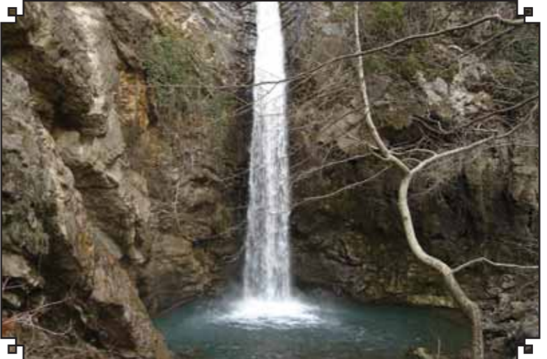
Osmaniye Karaçay Şelalesi