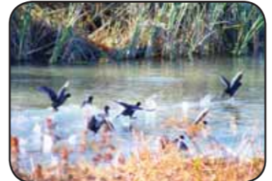
Kastabala Vadisi Kırmıtlı Kuş Cenneti - Osmaniye