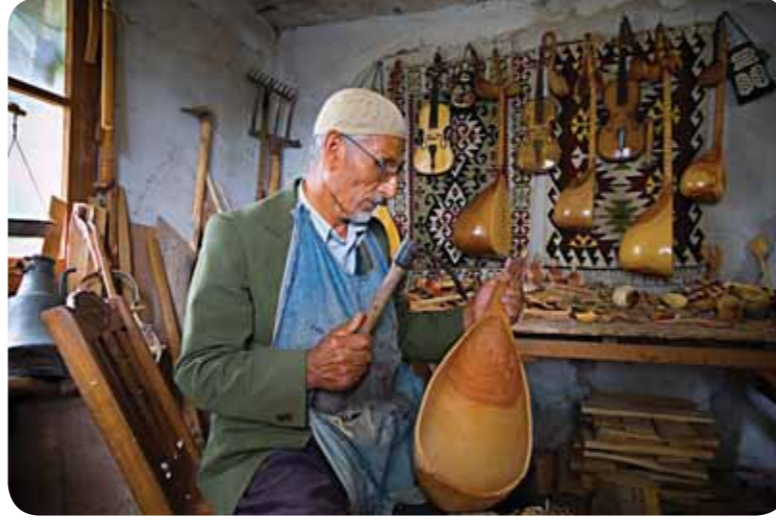
Ahşap işçiliği geleneksel sanatlarındandır.