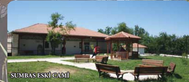
SUMBAS ESKİ CAMİ

Kadirli ilçe merkezinde bulunan camii, Roma, Bizans ve Türk kültürünü bir arada yaşatan önemli bir eserdir. Romalılar tarafından Manastır, Bizanslılar tarafında kilise Dulkadiroğulları zamanında da cami olarak kullanılmıştır.