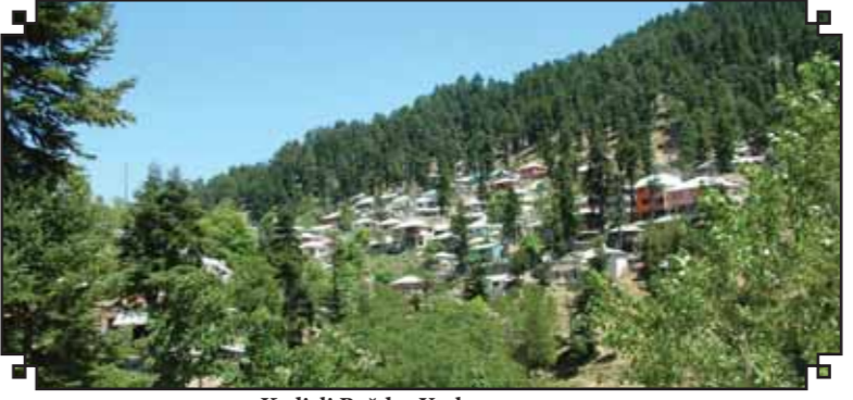
Kadirli Bağdaş Yaylası