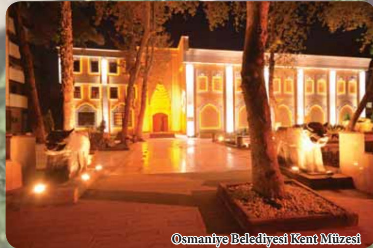
Osmaniye Belediyesi Kent Müzesi

Osmaniye, Akdeniz Bölgesi'nin ve Çukurova'nın doğusunda yer alır. Ulaşım açısından çok avantajlı konumdadır. TEM Otoyolu , D-400 Karayolu ve tren yolu şehrin merkezinden geçmektedir. Adana, Gaziantep, Hatay ve Kahramanmaraş illerine komşudur. Verimli toprakları, ılıman iklimi , denize yakınlığı, dağları, yaylaları, baraj gölleri, akarsuları , kaplıcaları , kaleleri, kültür ve tabiat varlıklarıyla alternatif turizm imkanlarını bir arada bulunmaktadır.