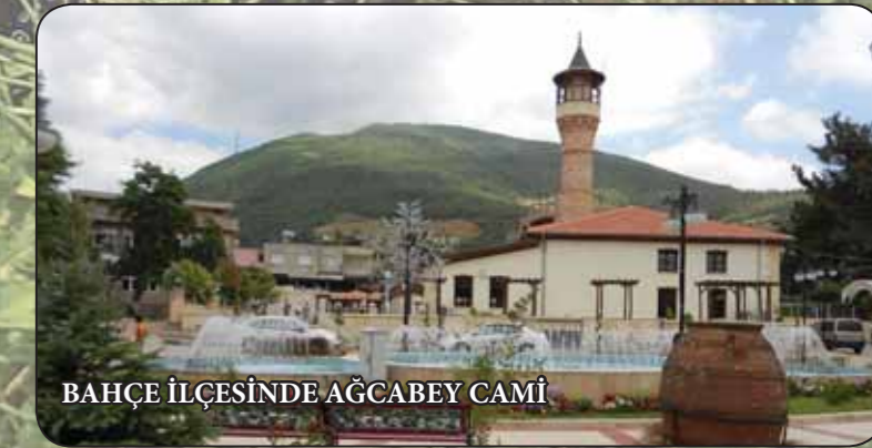
BAHÇE İLÇESİNDE AĞCABEY CAMİ