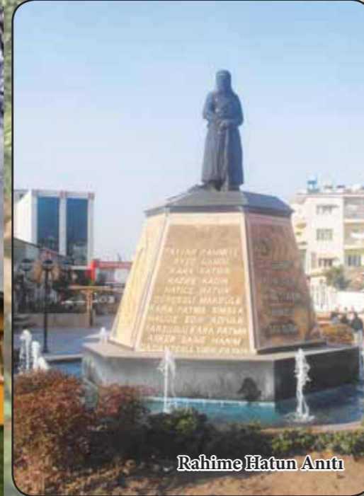
Rahime Hatun Anıtı