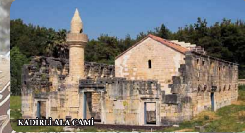
KADIRLI ALA CAMİ

Kadirli ilçe merkezinde bulunan camii, Roma, Bizans ve Türk kültürünü bir arada yaşatan önemli bir eserdir. Romalılar tarafından Manastır, Bizanslılar tarafında kilise Dulkadiroğulları zamanında da cami olarak kullanılmıştır.