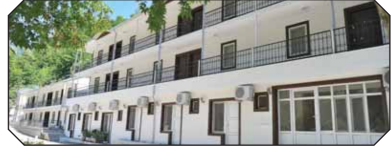
Düziçi İlçesi Haruniye Kaplıcası

Yaylacılık ilimiz kültüründe önemli yer oluşturmaktadır. İlimizi çevreleyen Orta Toros Dağlarında ve Amanos (Nur) Dağı üzerinde irili ufaklı 43 yayla bulunmaktadır. Zorkun yaylası Çukurova'nın en büyük yaylalarındandır.