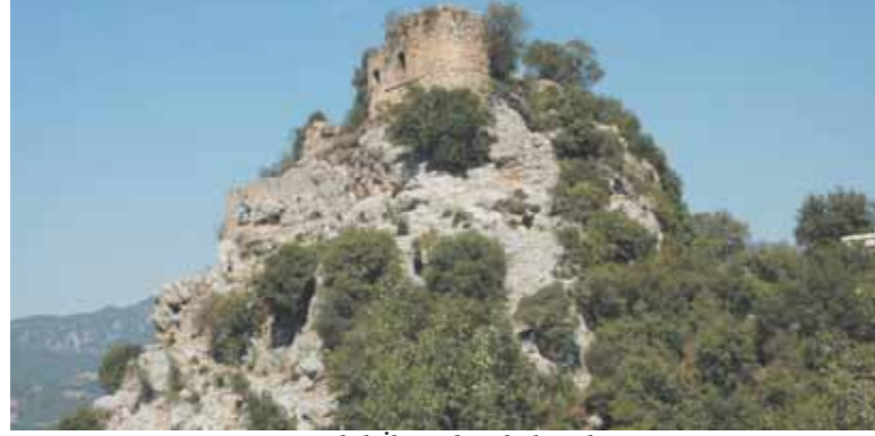
Kadirli İlçesinde Kalealtı Kalesi