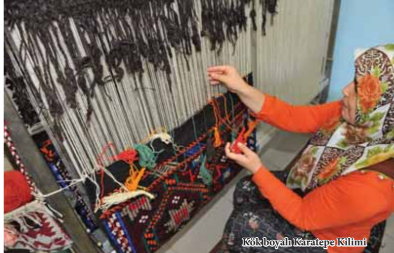
Kök boyalı Karatepe Kilimi