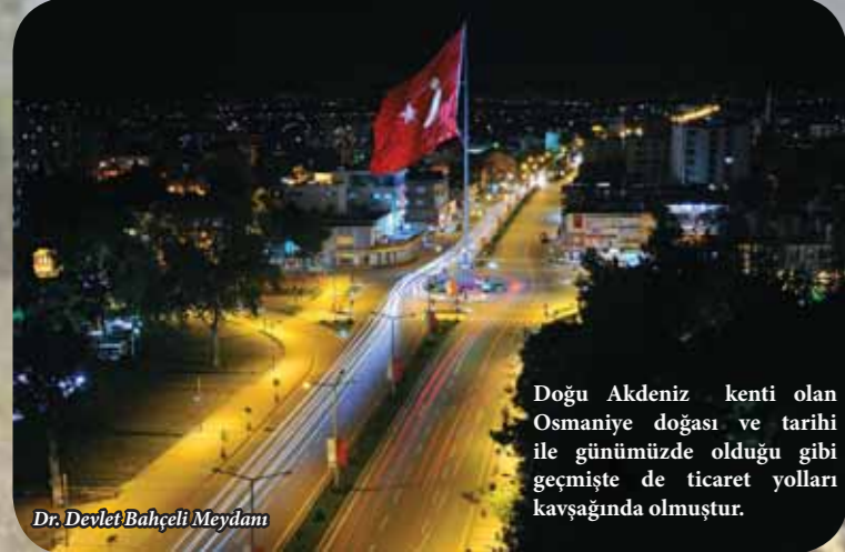
Dr. Devlet Bahçeli Meydanı

Doğu Akdeniz kenti olan Osmaniye doğası ve tarihi ile günümüzde olduğu gibi geçmişte de ticaret yolları kavşağında olmuştur.