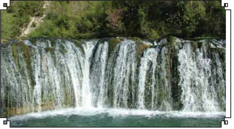
Sumbas İlçesi Şarлак Şelalesi