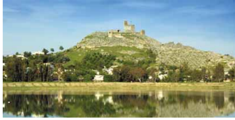
Hemite (Gökcedam) Kalesi ve Ceyhan Nehri