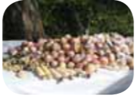
Kiriştek ( Topaç)