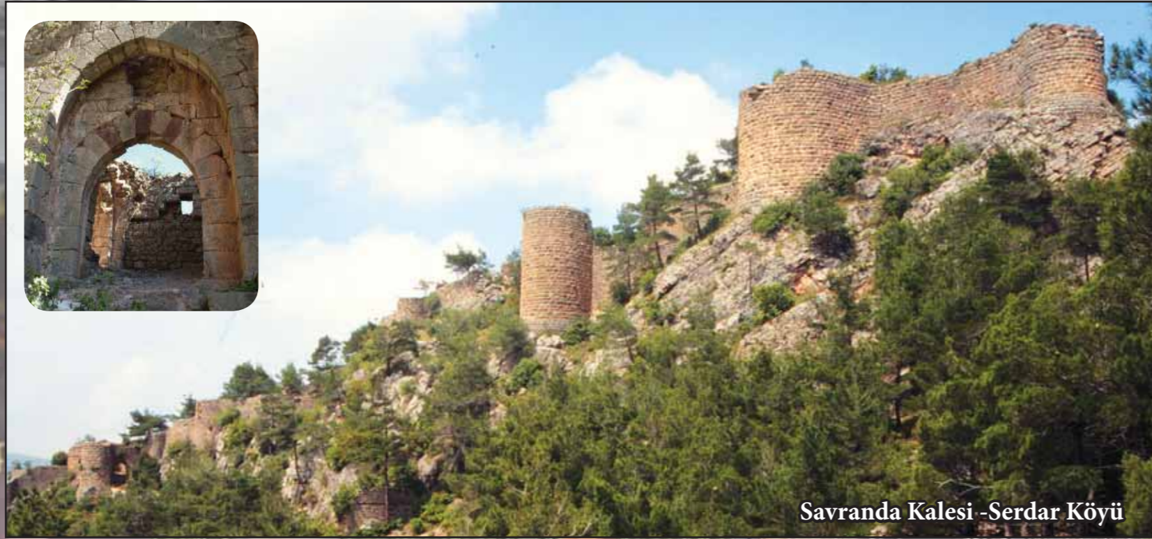
Savranda Kalesi -Serdar Köyü